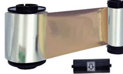
IDP Resin Metallic Gold Monochrome Ribbon Kit