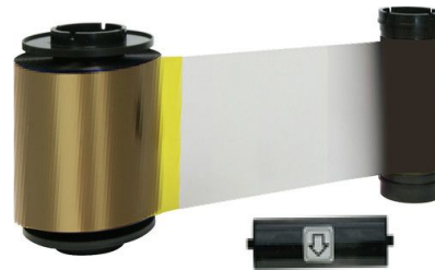
IDP YMCFKO Full Color Ribbon with UV Panel, Resin Black and Overlay