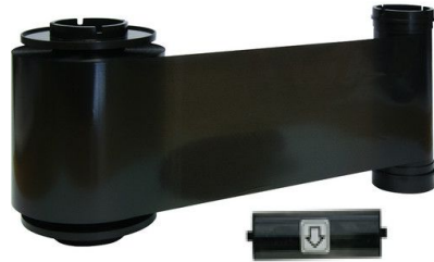
IDP Resin Black Monochrome Ribbon Kit