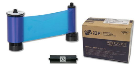
IDP Resin Blue Monochrome Ribbon Kit