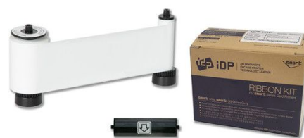
IDP Resin White Monochrome Ribbon Kit