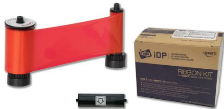
IDP Resin Red Monochrome Ribbon Kit