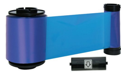
IDP Resin Blue Monochrome Ribbon Kit