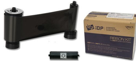
IDP Resin Black Monochrome Ribbon Kit