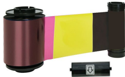
IDP YMCKOK Full Color Ribbon with Resin Black, Overlay & Black for Back Side