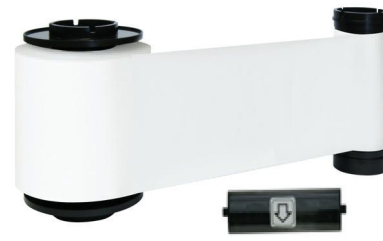
IDP Resin White Monochrome Ribbon Kit