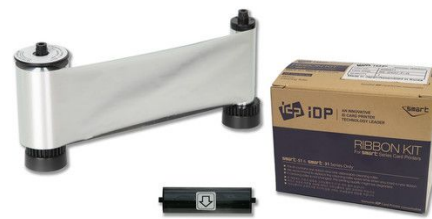
IDP Resin Metallic Silver Monochrome Ribbon Kit