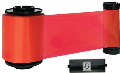
IDP Resin Red Monochrome Ribbon Kit