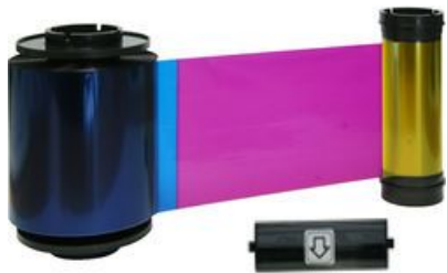
IDP YMCKO Full Color Ribbon with Resin Black & Overlay