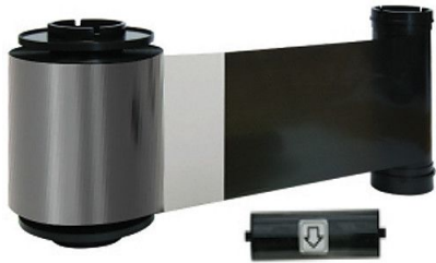
IDP Dye-Sub Black Monochrome with Overlay Ribbon Kit