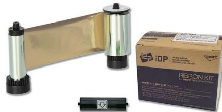
IDP Resin Metallic Gold Monochrome Ribbon Kit