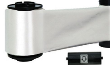
IDP Resin Metallic Silver Monochrome Ribbon Kit