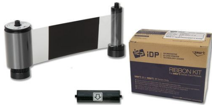
IDP Dye-Sub Black Monochrome with Overlay Ribbon Kit