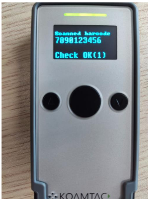
Hình 7 : Thông báo Check OK khi 2 barcode trùng nhau

Nếu barcode không trùng với barcode trước đó sẽ có thông báo “ Check failed ” (hình 8)