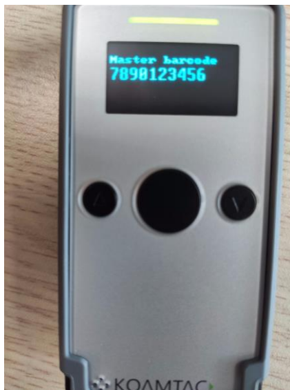
Hình 9 : Màn hình trở về trước khi check

+ Khi muốn thay đổi Master code ta bấm A1 để quét mã barcode mới (tường đương với chuyển sang một bệnh án mới)