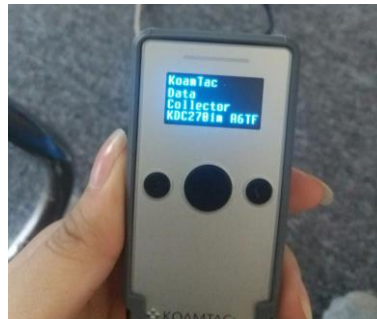
Hình 3: Màn hình hiển thị khi máy được bật

– Khởi động và Bật máy : Bấm giữ A2 trong 5-7 s cho đến khi màn hình sáng đèn như Hình 3