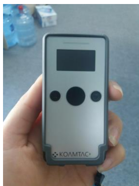
Hình 2: Mặt trước của máy khi ở chế độ tắt

Trạng thái khi chưa bật nguồn máy: Như trong Hình 2