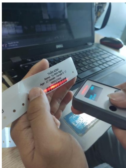
Hình 5: Thao tác quét barcode chính

Màn hình hiển thị một dãy số lấy ra từ barcode vừa quét và cũng là dòng code dùng để so sánh với các barcode sẽ quét tiếp theo (hình 6)