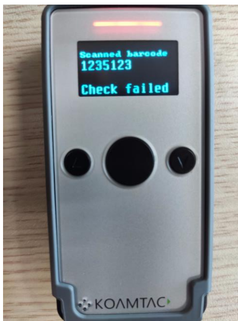
Hình 8: Thông báo Check failed khi 2 barcode không trùng nhau

Nếu barcode không trùng với barcode trước đó sẽ có thông báo “ Check failed ” (hình 8)